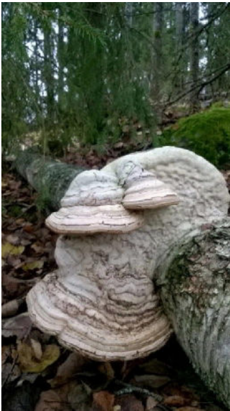
3. Etsi kääpäpuu. Juokse käävän luokse! (Taulakääpä)