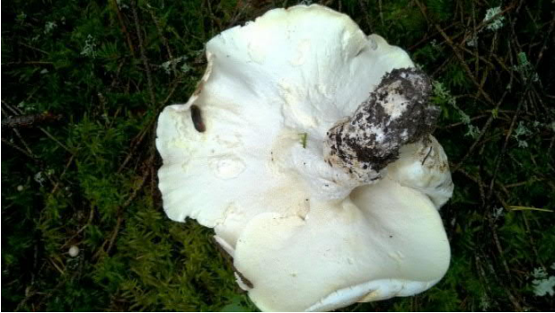
1. Etsi ruokasieni (Lampaankääpä)