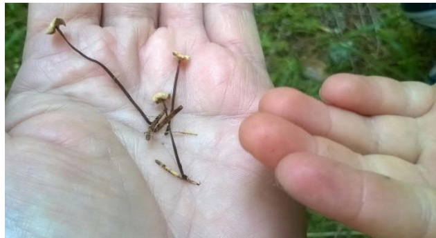
4. Sienet lahottajana Saatko neulasen mukana? (Kuusenneulasnahikas)