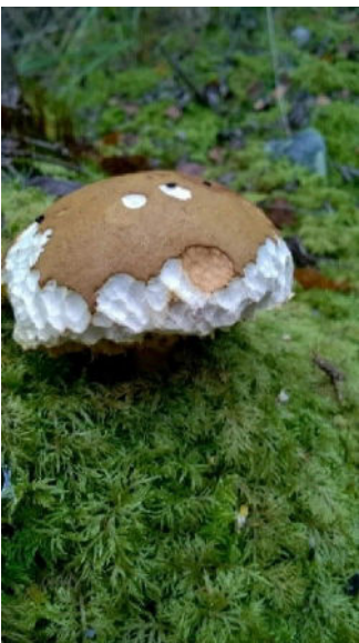
5. Tutki mikä eläin on syönyt sientä? (Herkkutatti)