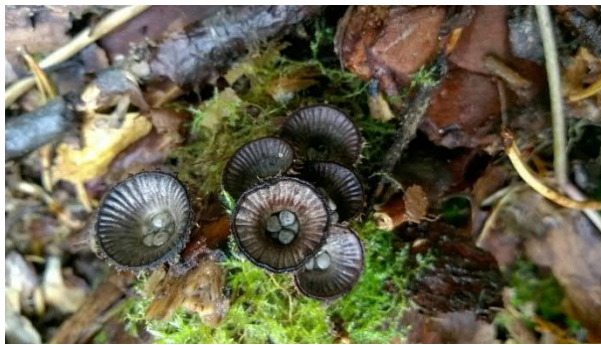
6. Tutki luopilla jotain pientä sientä? (Uurrepesäsieni)