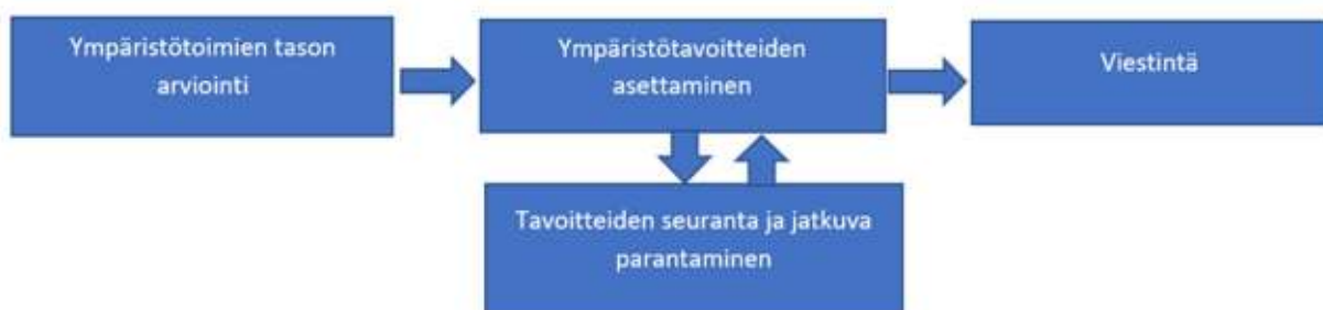
Kuva 1. Ympäristökäsikirjan käyttö